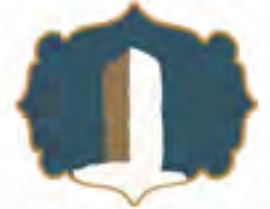
الوقوف بعرفة إلى غروب الشمس