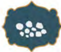
رمي الجمار والترتيب بينها