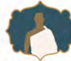
الإحرام عند الميقات