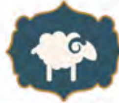
الهدى للمتمتع والقارن