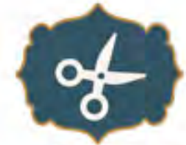
الحلق أو التقصير